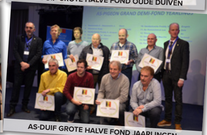
AS-DUIF GROTE HALVE FOND JAARLINGEN