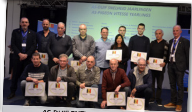
AS-DUIF SNELHEID JAARLINGEN