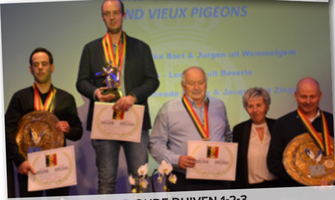
FOND OUDE DUIVEN 1-2-3