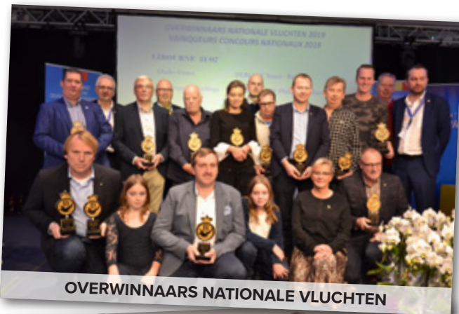
OVERWINNAARS NATIONALE VLUCHTEN