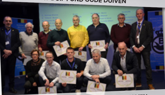
AS-DUIF KLEINE HALVE FOND OUDE DUIVEN