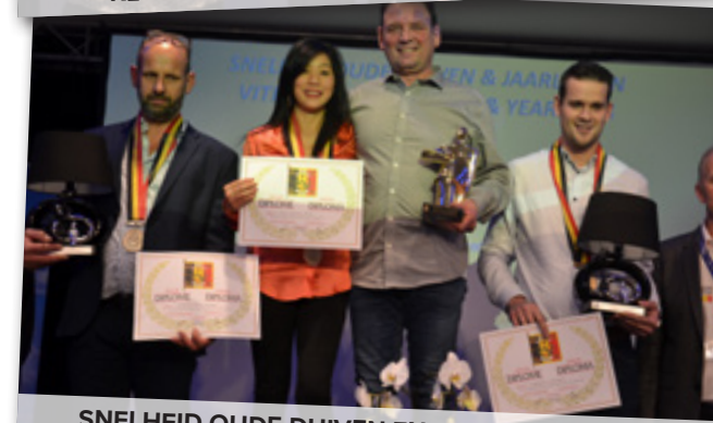
SNELHEID OUDE DUIVEN EN JAARLINGEN 1-2-3