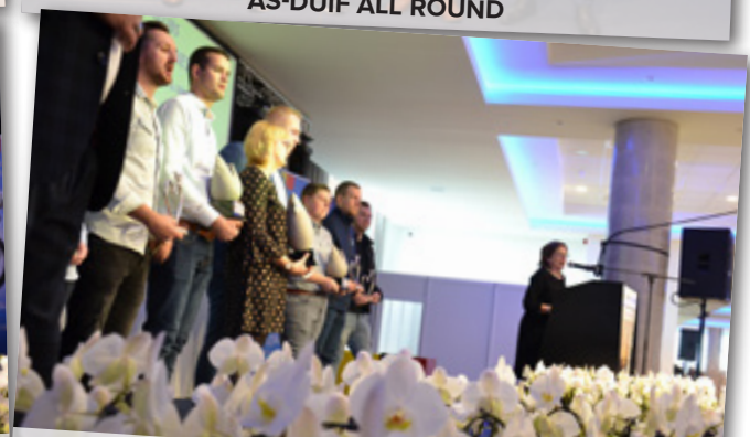
PAG. 8.10 - CRITERIUM JEUGDCLUBS 21 TOT 30 JAAR