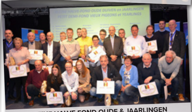
KLEINE HALVE FOND OUDE & JAARLINGEN