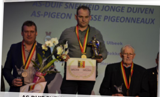
AS-DUIF SNELHEID JONGE DUIVEN - 1-2-3