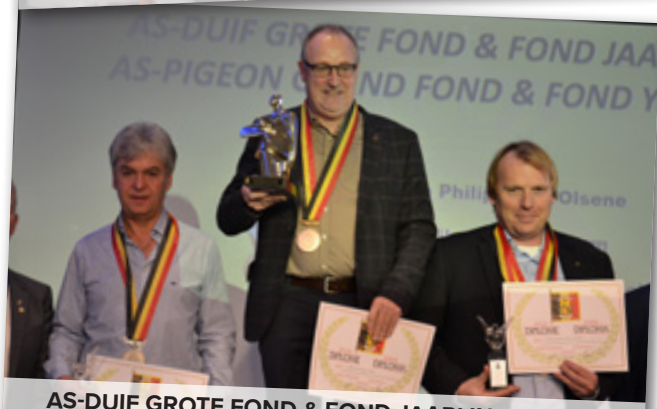
AS-DUIF GROTE FOND & FOND JAARLINGEN 1-2-3