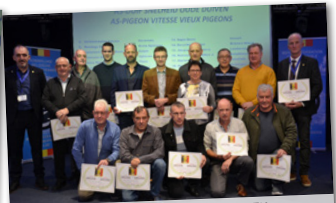
AS-DUIF SNELHEID OUDE DUIVEN