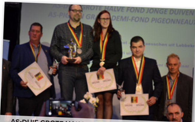
AS-DUIF GROTE HALVE FOND JONGE DUIVEN 1-2-3