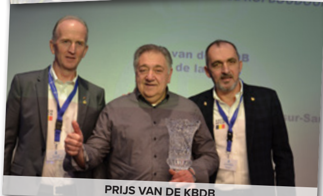
PRIJS VAN DE KBDB