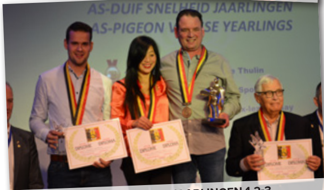
AS-DUIF SNELHEID JAARLINGEN 1-2-3