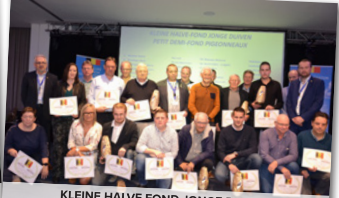
KLEINE HALVE FOND JONGE DUIVEN