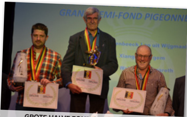
GROTE HALVE FOND JONGE DUIVEN 1-2-3