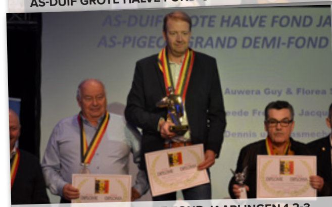
AS-DUIF GROTE HALVE FOND JAARLINGEN 1-2-3