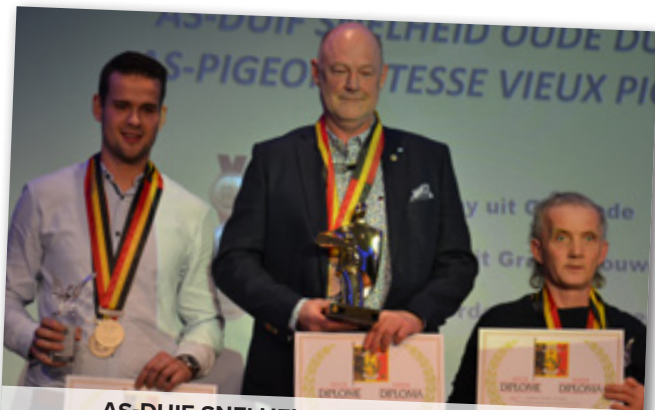
AS-DUIF SNELHEID OUDE DUIVEN 1-2-3