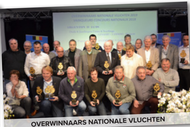
OVERWINNAARS NATIONALE VLUCHTEN