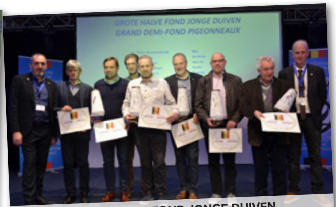
GROTE HALVE FOND JONGE DUIVEN