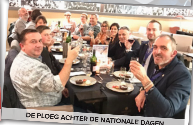
DE PLOEG ACHTER DE NATIONALE DAGEN