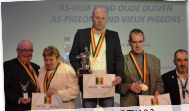
AS-DUIF FOND OUDE DUIVEN 1-2-3