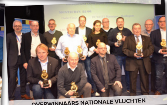
OVERWINNAARS NATIONALE VLUCHTEN