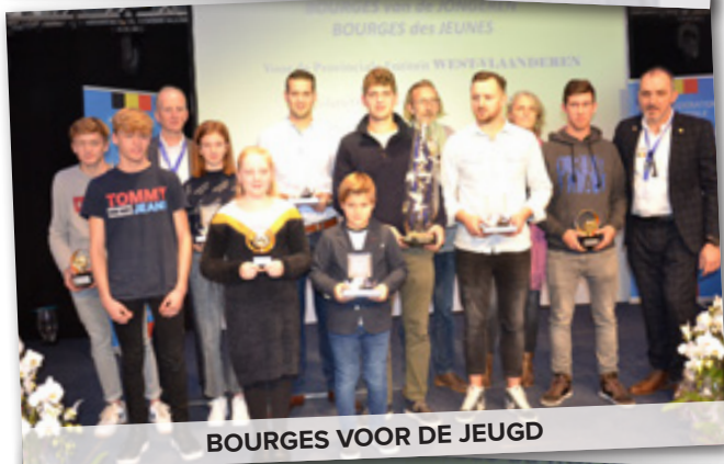
BOURGES VOOR DE JEUGD