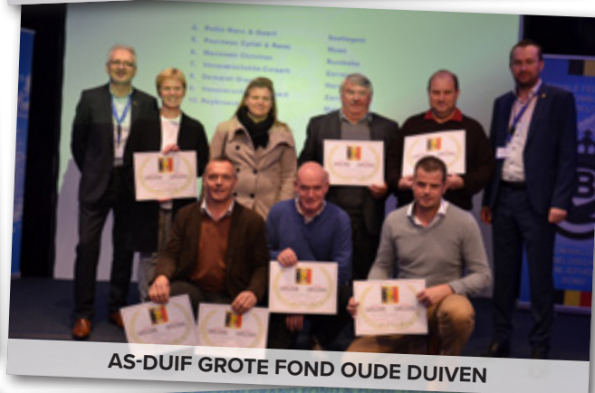
AS-DUIF GROTE FOND OUDE DUIVEN