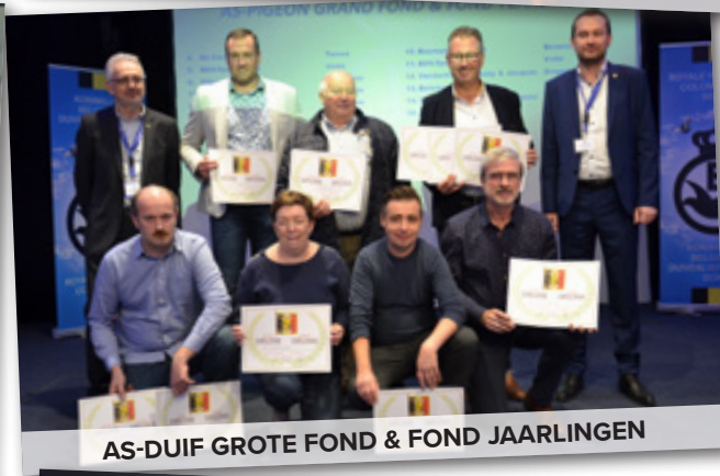
AS-DUIF GROTE FOND & FOND JAARLINGEN