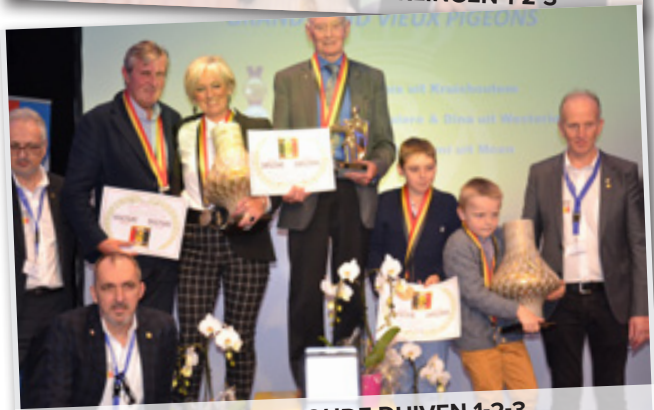
GROTE FOND OUDE DUIVEN 1-2-3