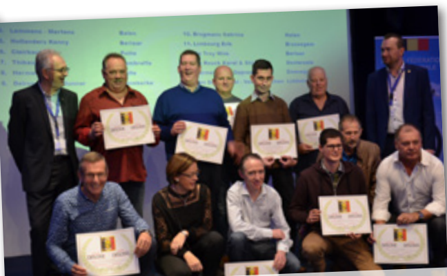
AS-DUIF GROTE HALVE FOND JONGE DUIVEN