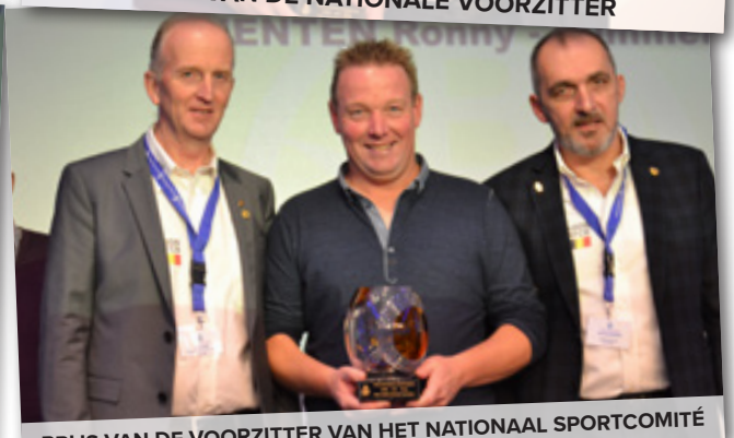
PRIJS VAN DE VOORZITTER VAN HET NATIONAAL SPORTCOMITÉ