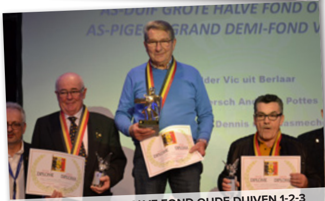
AS-DUIF GROTE HALVE FOND OUDE DUIVEN 1-2-3