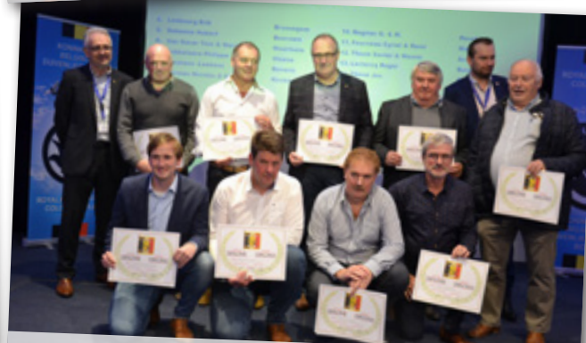
AS-DUIF FOND OUDE DUIVEN