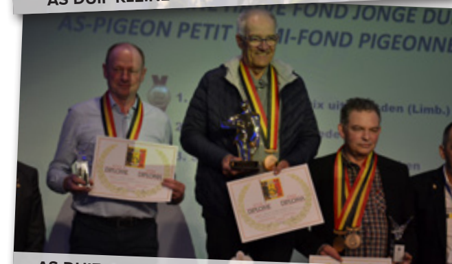
AS-DUIF KLEINE HALVE FOND JONGE DUIVEN 1-2-3