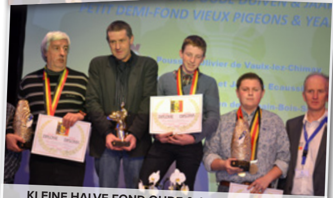
KLEINE HALVE FOND OUDE & JAARLINGEN 1-2-3