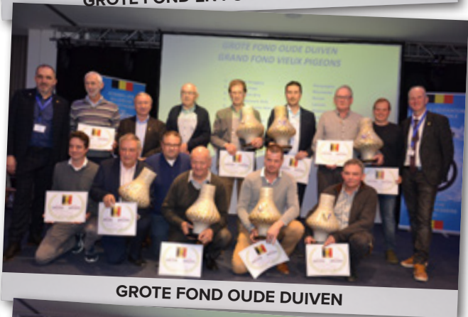
GROTE FOND OUDE DUIVEN