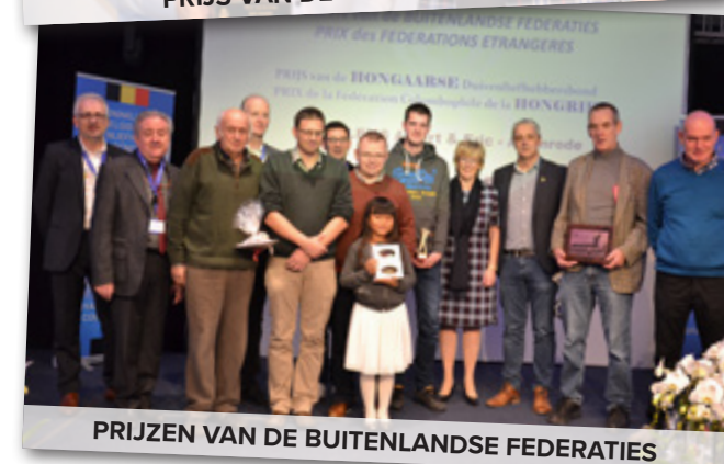
PRIJZEN VAN DE BUITENLANDSE FEDERATIES