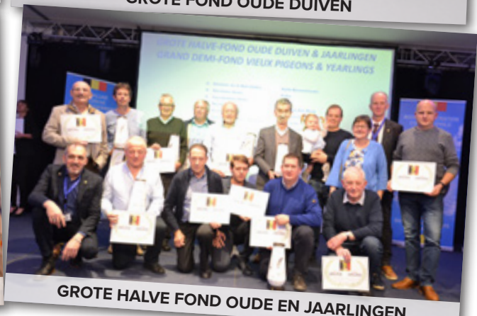
GROTE HALVE FOND OUDE EN JAARLINGEN