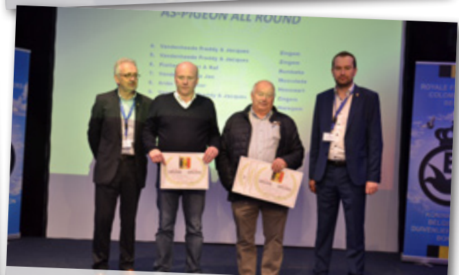
AS-DUIF ALL ROUND