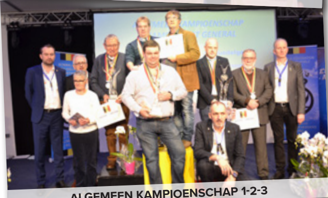
ALGEMEEN KAMPIOENSCHAP 1-2-3