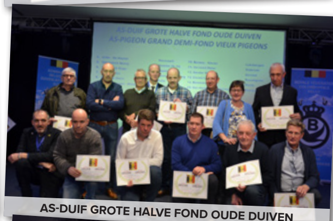
AS-DUIF GROTE HALVE FOND OUDE DUIVEN