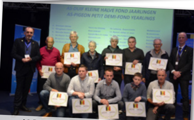
AS-DUIF KLEINE HALVE FOND JAARLINGEN