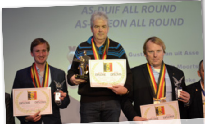
AS-DUIF ALL ROUND 1-2-3