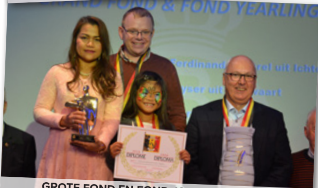
GROTE FOND EN FOND JAARLINGEN 1-2-3