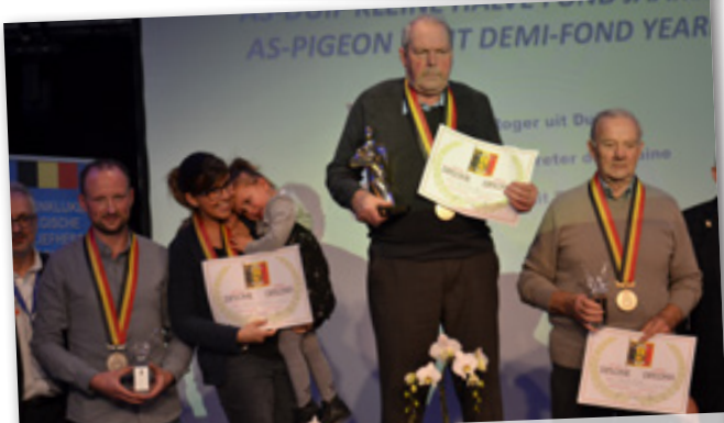
AS-DUIF KLEINE HALVE FOND JAARLINGEN 1-2-3