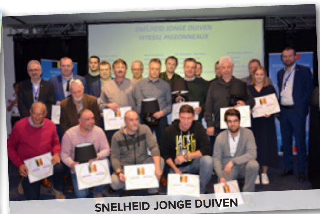
SNELHEID JONGE DUIVEN