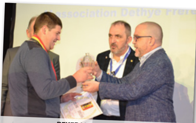
BEKER VAN DE KONING