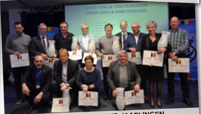
GROTE FOND EN FOND JAARLINGEN