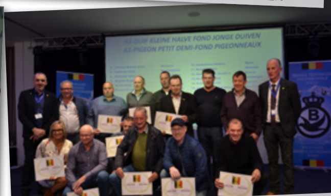
AS-DUIF KLEINE HALVE FOND JONGE DUIVEN