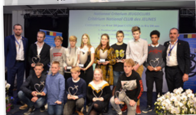
CRITERIUM JEUGDCLUBS 6 TOT 20 JAAR