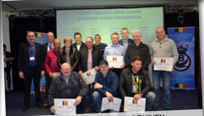
AS-DUIF SNELHEID JONGE DUIVEN