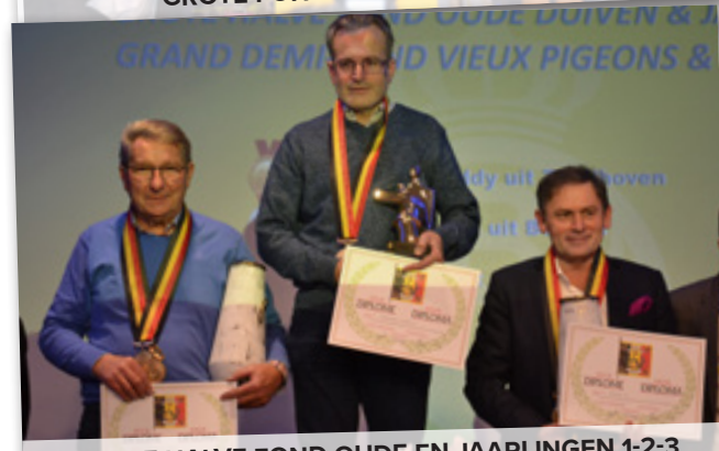
GROTE HALVE FOND OUDE EN JAARLINGEN 1-2-3