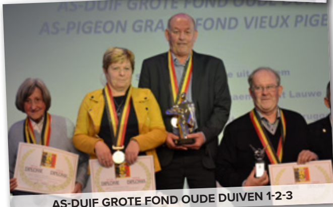
AS-DUIF GROTE FOND OUDE DUIVEN 1-2-3