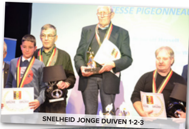
SNELHEID JONGE DUIVEN 1-2-3