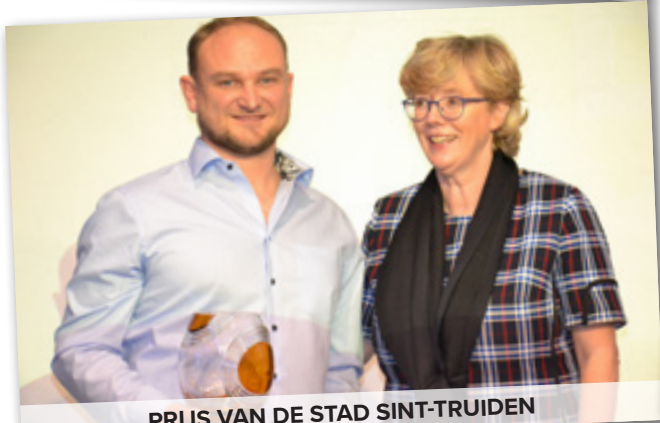
PRIJS VAN DE STAD SINT-TRUIDEN