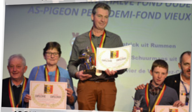
AS-DUIF KLEINE HALVE FOND OUDE DUIVEN 1-2-3