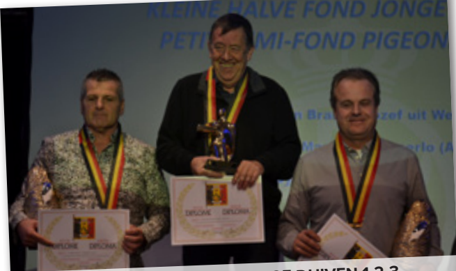
KLEINE HALVE FOND JONGE DUIVEN 1-2-3