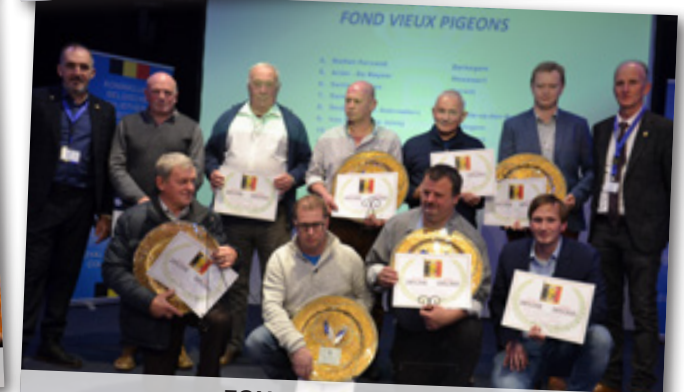
FOND OUDE DUIVEN