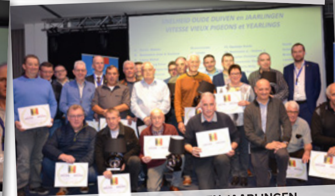
SNELHEID OUDE DUIVEN EN JAARLINGEN