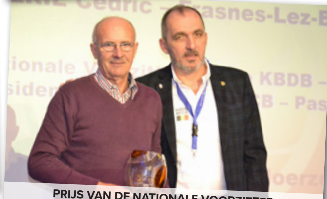
PRIJS VAN DE NATIONALE VOORZITTER